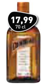
COINTREAU Sinaasappel- likeur