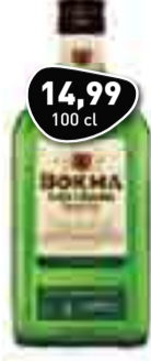
BOKMA Oude Jenever