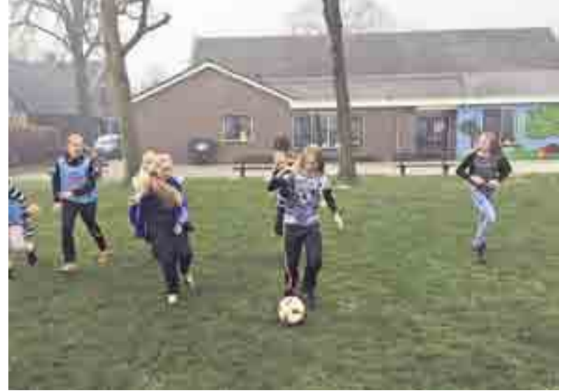
Enthousiaste meiden aan het voetballen.

WILP-ACHTERHOEK.- S.V. Voorwaarts heeft 2 voetbalclubs verzorgd bij basisschool O.B.S. Wilp Achterhoek. Deze clinic was voor alle jongens en meisjes van de groepen 4 tot en met 8. Om het meidenvoetbal extra aandacht te geven wordt er door de dames/meidencommissie van Voorwaarts ingezet op school en voetbalclubs. De 1ste clinic vond donderdag 14 april plaats op het schoolplein van Wilp Achterhoek. De 2de clinic vond donderdag 21 april plaats op sportpark de Laene in Twello. Alle kinde-