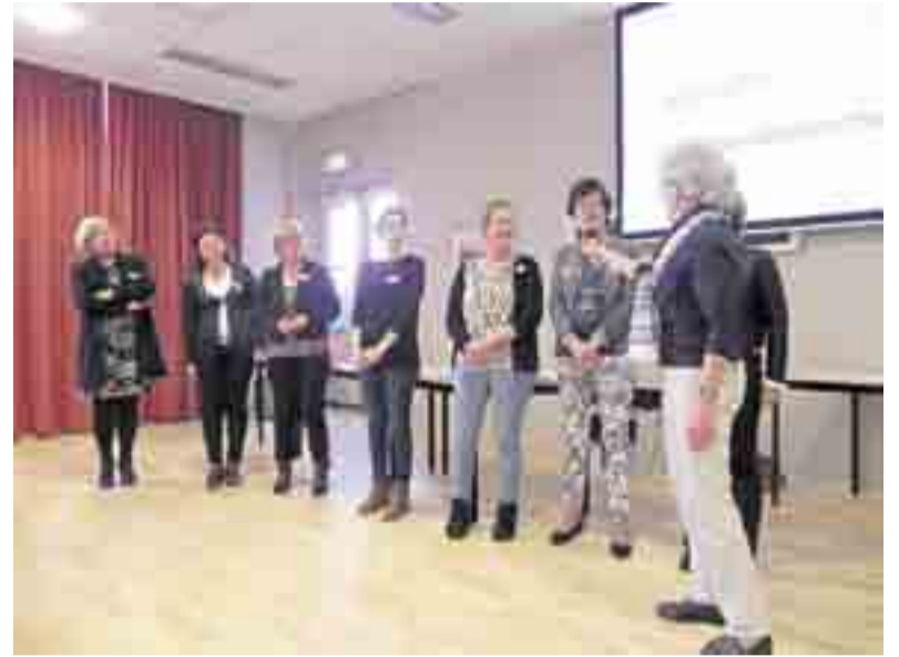
Dames van verschillende organisaties zijn de hele avond in Gebouw Irene beschikbaar.