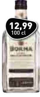
BOKMA Jonge Graanjenever