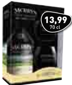
MERRYS Witte Chocolate Likeur