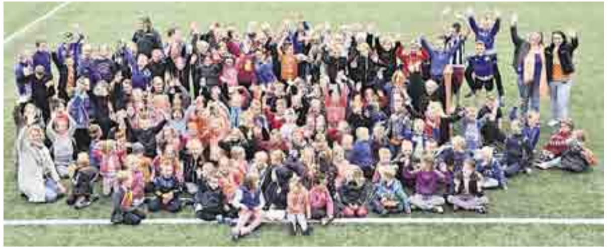
Koningspelen De Kopermolen.

KLARENBEEK.- Op vrijdag 22 april werden ook op De Kopermolen De Koningspelen gevierd. Er werd deze dag begonnen met een heerlijk ontbijt. Daarna werden de Koningspelen geopend met het lied 'Hupsakee' van Kinderen voor Kinderen. Op het plein werd er fanatiek