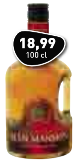
GLEN MANSION Blended Scotch Whisky