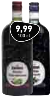
BOOMSMA Wilde Vlierbessen of Wilde Bramen

Voor een goed advies en persoonlijke service bent u bij uw topSlijter Ruud Bakker aan het juiste adres!