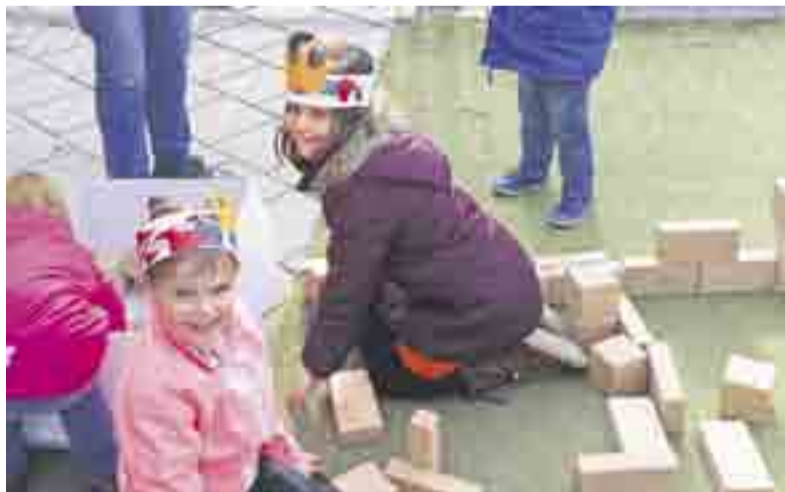
Kinderen genieten van de Koningspelen.

WILP.- Vrijdag 22 april was het groot feest voor de leerlingen van de Daniël de Brouwerschool, net als vele andere kinderen deden ook zij mee aan de Koningspelen. Alle leerlingen, meesters en juffen stonden om 09.00 uur klaar voor een warming-up. Vervolgens dansten zij samen de Koningsdans op het liedje "Hupsakee" van kinderen voor kinderen. Na deze vrolijke start begonnen de spelletjes rondom het thema oranje/koningshuis. Er werd koninklijk gedanst bij de hoepeldans en bij de gouden koets werd een estafette spel gespeeld. Bij het spel "koning door de poort" mochten de kinderen voetballen. Ook werd er gesjoeld met koninklijke munten. Bij het ringsteken ging het er fanatiek aan toe. De kinderen probeerden, al galopperend op een stokpaard, zoveel mogelijk ringen te verzamelen. De spelletjes werden afgesloten met het uitreiken van echte diploma's. De leerlingen kijken terug op een feest-