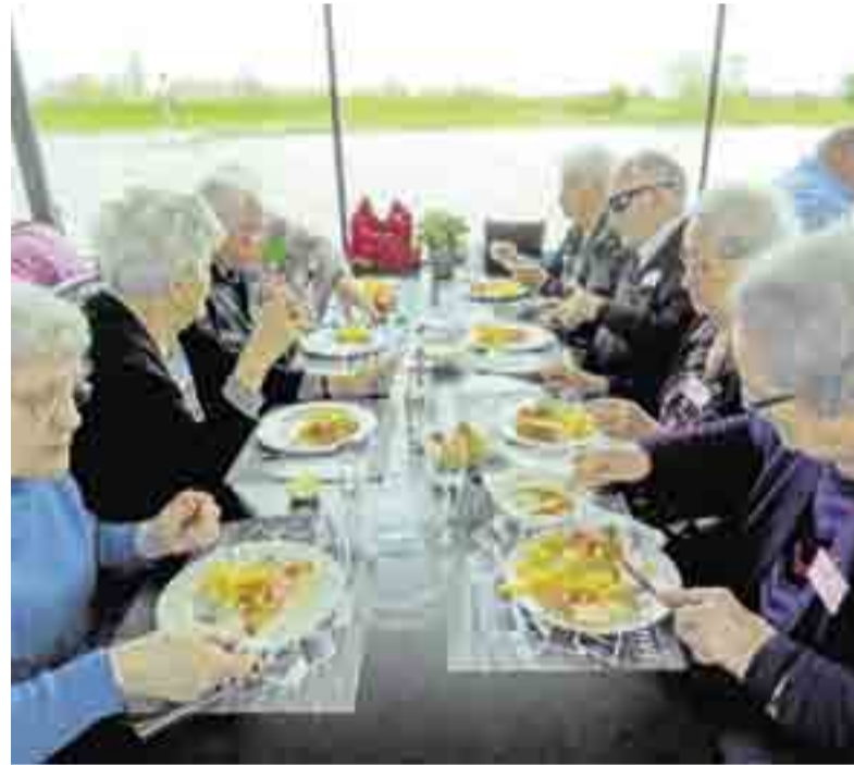
Genieten van een heerlijke maaltijd en prachtig uitzicht.

Het mooie weer liet het zelfs toe, dat op het bovendeck een luchtje kon worden geschept. Ook werd de mogelijkheid geboden om een kijkje te komen nemen in de stuurhut. Het 40 meter lange schip is 3 jaar geleden in de vaart gebracht, het is een moderne boot die met behulp van z'n Z-drive ter hoogte van Hattem simpel om de as draaide, waarna de terugtocht kon worden aanvaard. Rond 14:30 uur ging voor de gasten de Bingo van start. Tijdens het af-