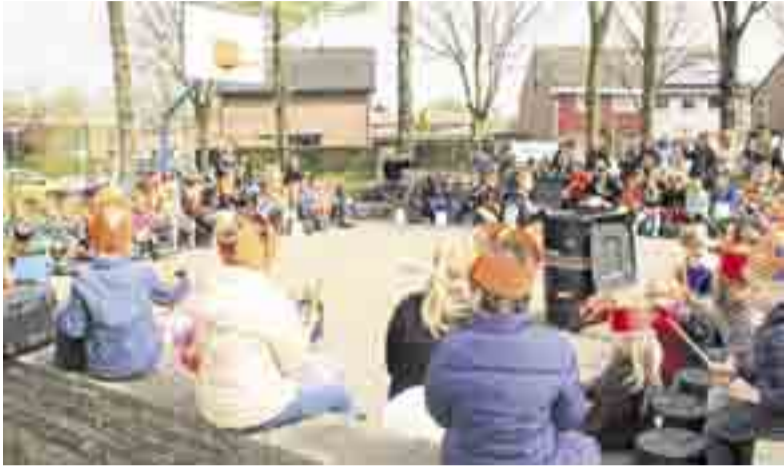
Tot slot een concert voor de school

VOORST.- Alle leerlingen kwamen vrijdag in sportieve 'oranje'-kleding op school, waar de dag begonnen werd met het openingslied "Hupsakee".