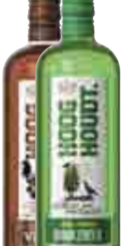
Hooghoudt Jonge Dubbele Graanjenever Vieux

Rocky Cove Special Selection South Eastern Australia Shiraz Chardonnay 75 cl. Per fles 4,99