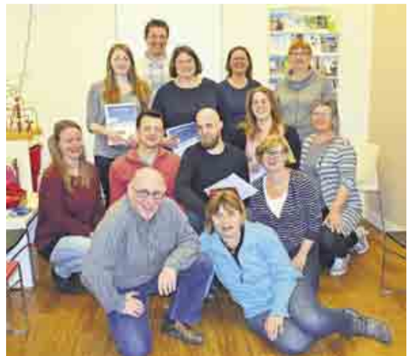
Geslaagde EHBO-ers bij Rode Kruis Voorst.

Bent u ook geïnteresseerd in een EHBO-cursus, alleen een certificaat Reanimatie AED bedienen of Baby en Kinder-EHBO neem dan contact op met opleidingen@rodekruisvoorst.nl of 055 - 543 11 65. In september worden er weer een nieuwe cursussen gestart.