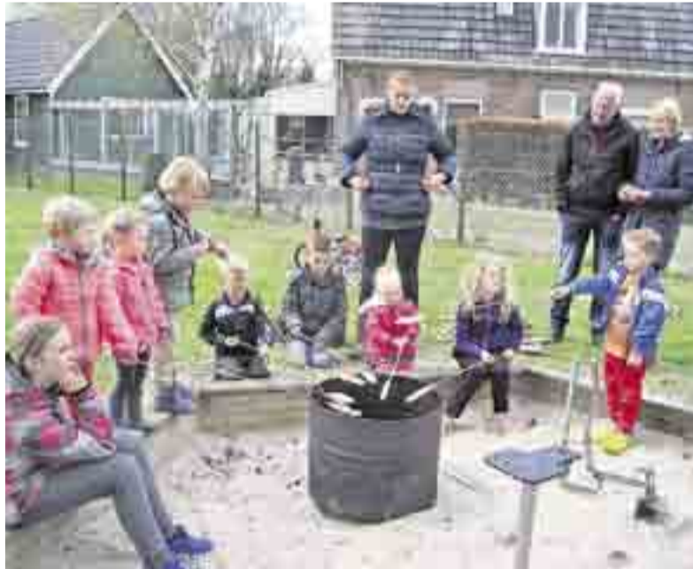
Gezellig samen broodjes bakken in de speeltuin.

POSTERENK.- Het is tijd om lekker naar buiten te gaan. Dat vinden ook de kinderen uit Posterenk. Afgelopen zaterdag startte het speeltuinseizoen in Speeltuin Klein Pampus. Gezellig spelen, dansen en samen broodjes bakken. Speeltuin Klein Pampus is de plek waar kinderen uit het dorp samenkomen. Het is een belangrijke voorziening voor de kern Posterenk. Ook veel kinderen uit de omliggende dorpen maken graag gebruik van de speeltuin. Er zijn toestellen voor alle leeftijden. In de matschommel kunnen baby's heerlijk heen en weer wiegen. Op de paardjes en wipwag vinden de peuters hun draai. Het speelhuisje en de kabelbaan zijn een uitdaging voor de grotere kinderen. Voor jongeren en volwassenen is er alle ruimte om te voetballen. Speeltuincommissie Klein Pampus organiseert af en toe kleinschalige activiteiten. Op de facebookpagina staat alle informatie: www.facebook.com/Klein-Pampus .