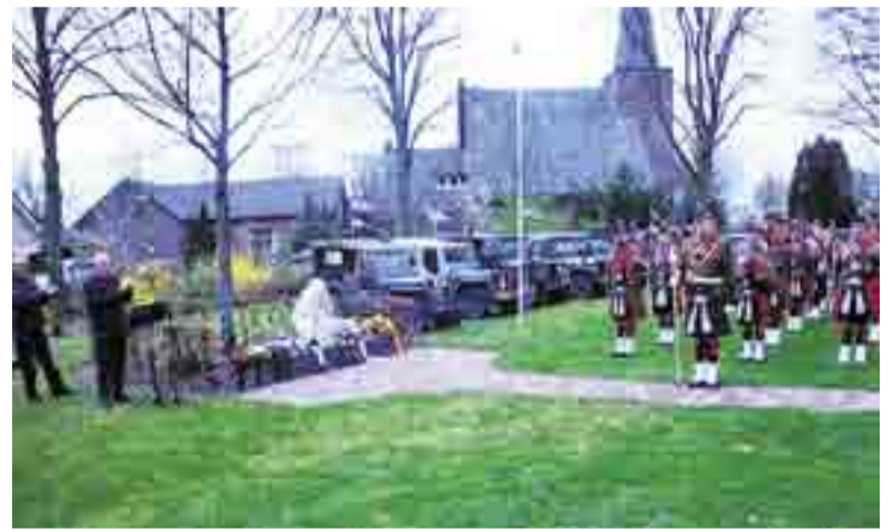
Druk bezochte herdenking bevrijding Beekbergen, Lieren en Oosterhuizen.

OOSTERHUIZEN.- Het bevrijdingscomité Beekbergen, Lieren en Oosterhuizen organiseerde maandag 18 april de herdenking van 71 jaar bevrijding van deze drie dorpen.