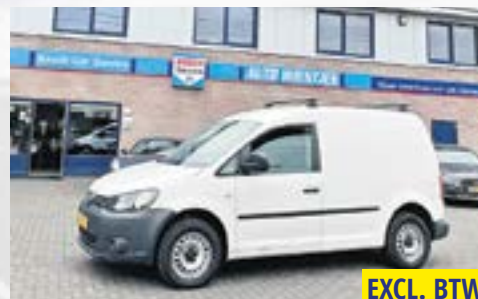
VW CADDY 1.6 TDI BLUE-MOTION COMFORT 93.000 KM - 2014 EXCL. BTW NU VOOR €7.450