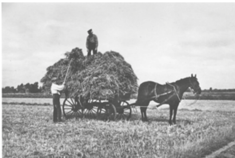
Vroeger was het zwaar werk voor de boeren met het hooien

TWELLO.- De boeren staan de laatste jaren vaak negatief in het nieuws. 'De boer heeft het altijd gedaan' wordt door hen vaak gezegd. De boeren moeten het uiterste doen om hun hoofd