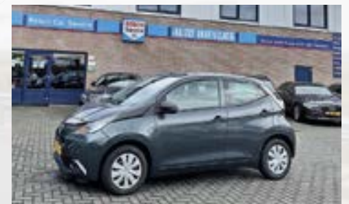
TOYOTA AYGO 1,0 VVT-I X-FUN 16.000 KM - 2017 NU VOOR €8.945