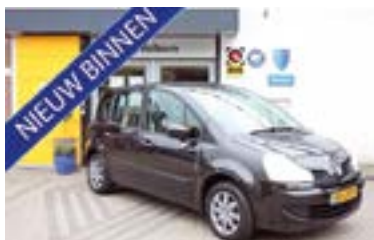
Renault Grand Modus 1.6-16V Dynamique + Airco + Trekhaak, NL auto dealer onderhouden Bouwjaar: 2010 | 142.895 km | €4.750