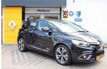
Renault Scénic IV 1.2 TCE Intens + Navi + Stoelverw. + Dealer onderhouden Bouwjaar: 2017 | 78.875 km | €17.450