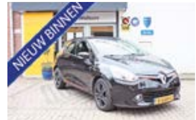
Renault Clio IV TCE 90 Expression + Navi + Airco, NL auto, dealer onderhouden Bouwjaar: 2013 | 136.200 km | € 7.950