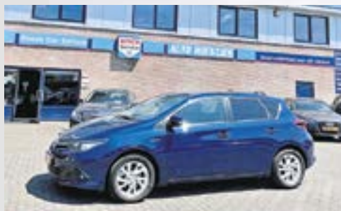
TOYOTA AURIS 1.8 DYNAMIC 65.000 KM - 2017 NU VOOR €16.450