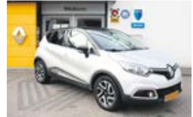
Renault Captur TCE 90 Dynamique + Navi + 17 inch Bouwjaar: 2015 | 56.700 km | €12.250