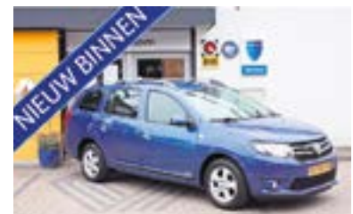
Dacia Logan MCV TCE 90 Prestige + Airco + Navi, NL auto dealer onderhouden Bouwjaar: 2014 | 57.459 km | €7.950

Voor onze complete voorraad kijk op: www.garageleijenaar.nl