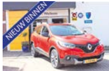
Renault Kadjar TCE Bose Bouwjaar: 2017 | 69.383 km | €17.250

Koekendijk 8 | 7437 CK Bathmen | 0570 541224