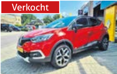
Renault Captur TCE 90 Intens + Camera, NL auto + dealer onderhouden Bouwjaar: 2019 | 28.429 km | €17.950