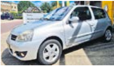
Renault Clio II 1.4-16V Campus + Trekhaak + Airco + Winterbanden, NL Auto + dealer onderhouden Bouwjaar: 2007 | 114.997 km | €3.250

RENAULT Passion for life GARAGE LEIJENAAR DACIA Koekendijk 8 | 7437 CK Bathmen | 0570 541224 BATHMEN