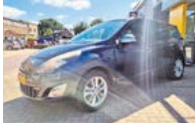
Renault Grand Scénic III 1.4 TCe 130 Celsium + Trekhaak, NL auto + dealer onderhouden Bouwjaar: 2010 | 170.632 km | €7.250