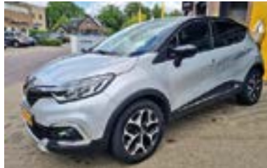
Renault Captur TCE 90 Intens + Camera + Navi, NL auto + dealer onderhouden Bouwjaar: 2018 | 40.651 km | €16.450