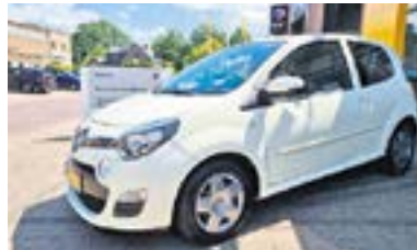
Renault Twingo 1.2 16V Collection + Airco + Cruise, NL auto + dealer onderhouden Bouwjaar: 2012 | 118.373 km | €5.250