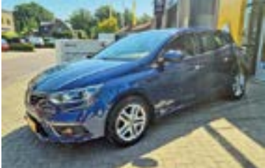
Renault Mégane IV HB TCE 130 Zen + Handsfree + Trekhaak + PDC, NL auto + dealer onderhouden Bouwjaar: 2016 | 79.146 km | €13.950