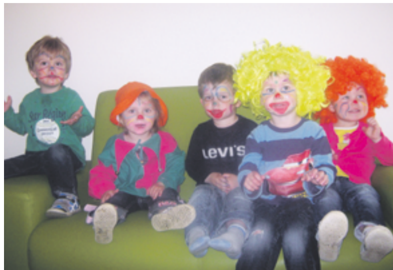
De clowns van KDV Ut Trepke zijn er al klaar voor.

VOORST.- Zaterdag 2 juni van 11.00 tot 15.00 uur wordt op Kinderdagverblijf Ut Trepke, Rijksstraatweg 87 in Voorst het ingezamelde speelgoed verkocht waarvan de opbrengst ten goede komt aan de Clini Clowns.