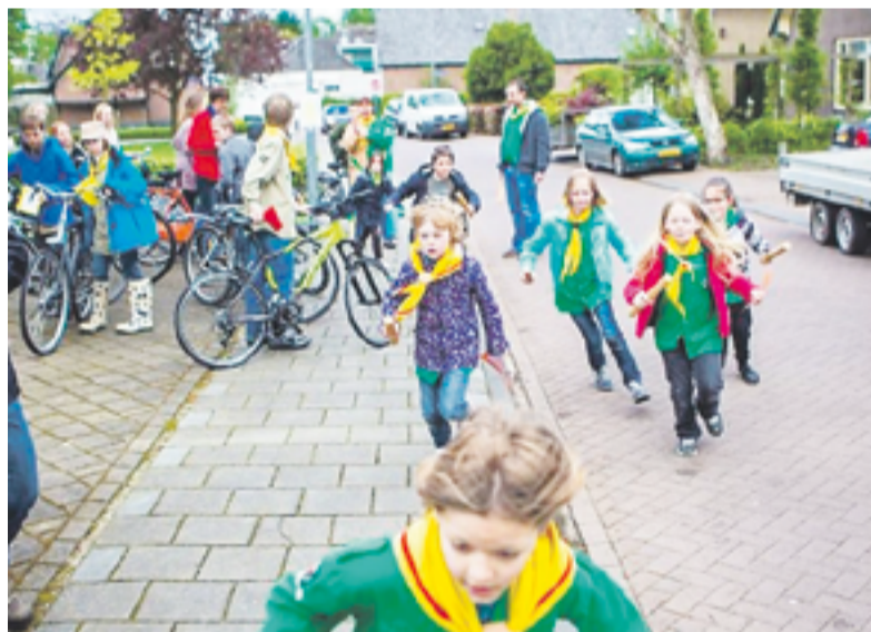
De welpen aan het rennen rondom de Muziekent

VOORST.- Hoe krijg je Scouts - kleine en grote - een uur lang aan het rennen en fietsen? Door ze samen een estafette te laten doen!