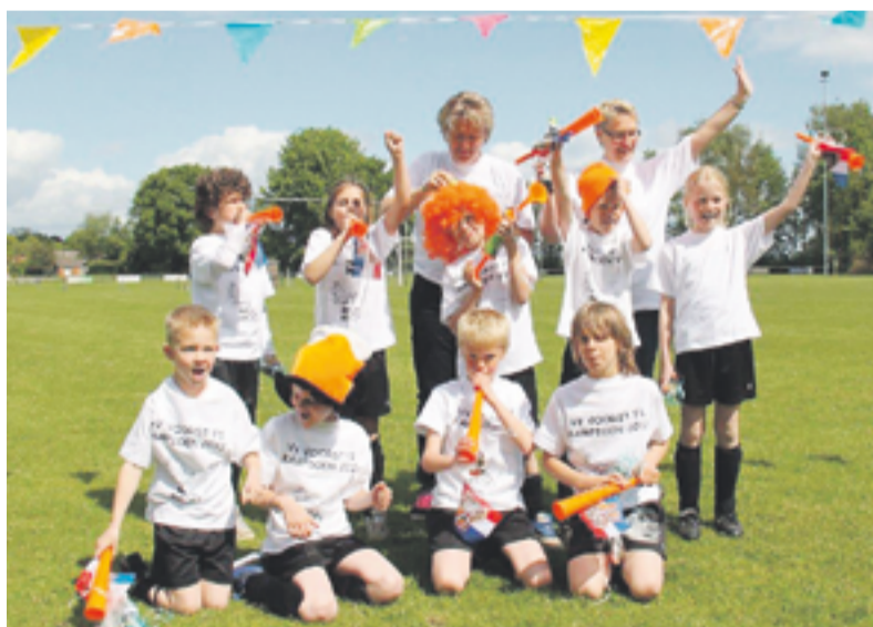
De kampioenen van F1

VOORST.- De F1 van de voetbalvereniging VV Voorst is kampioen! Nadat twee weken geleden de directe concurrent Sallandia op eigen veld werd verslagen werd zaterdag bij CSV in Apeldoorn het kampioenschap behaald.