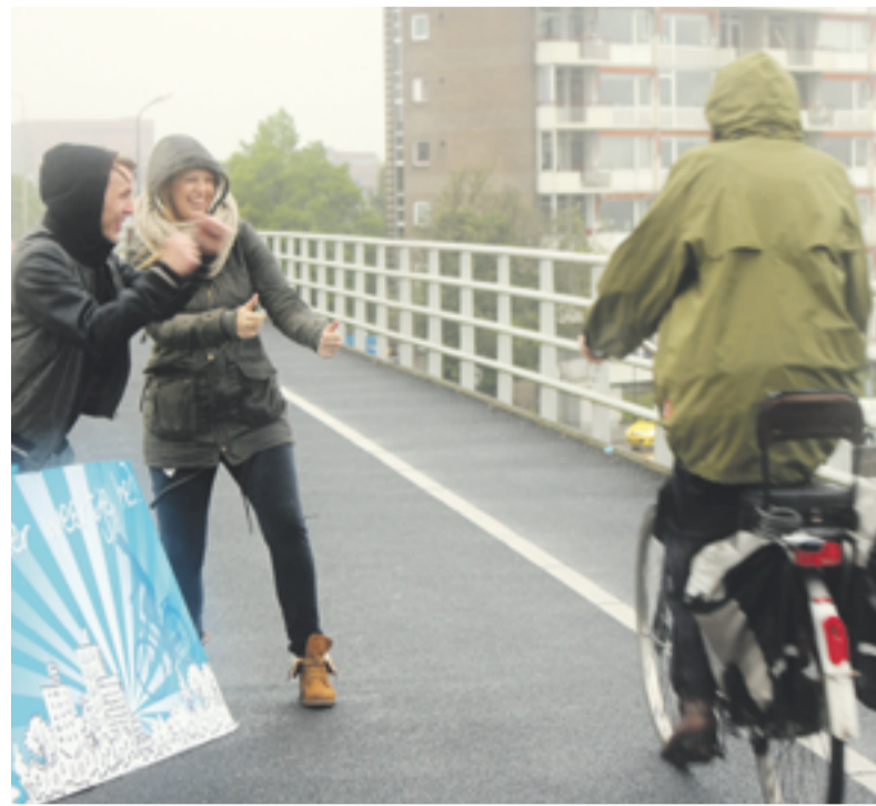
De fietsers die ondanks de felle regen toch op de fiets naar het werk gingen mochten rekenen op een extra applausje.

TWELLO.- Donderdag 10 mei was het Fiets naar je Werk Dag, een dag waarop mensen gestimuleerd werden om een dagje hun auto te laten staan en de fiets te pakken voor het dagelijkse ritje woon-werkverkeer. Platform Slim Werken Slim Reizen Stedendriehoek zette zich in voor het verminderen van het aantal autokilometers in de spits. Fiets naar je Werk Dag sluit goed aan op hun visie, dus bedacht het platform een leuke actie om alle fietsers aan te moedigen vaker de fiets te pakken.