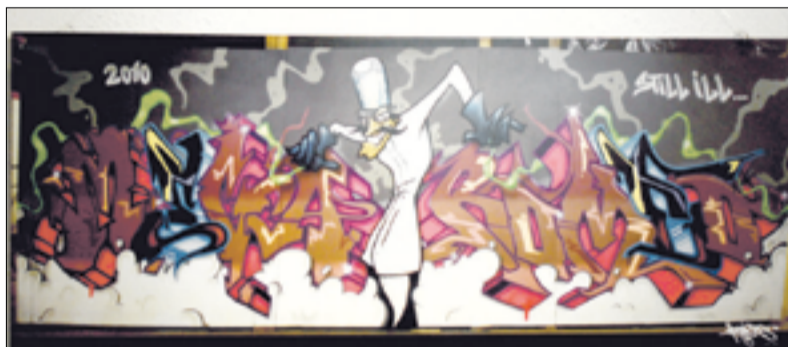
"Still Ill" Sneek - The Netherlands 2010 - foto-expositie gemeentehuis

Over twee weken worden de plannen in Twello en Terwolde besproken.