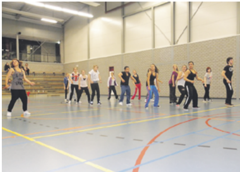
Hiphop bij sv Twello.

TWELLO.- Op 27 april is een workshop hiphop gestart bij de afdeling Gym van SV Twello. Deze workshop bestaat uit 8 lessen van 1,5 uur. Na een werving en het zoeken van geschikte leiding werd al snel duidelijk dat er voldoende deelnemers zijn, die interesse hebben in dit nieuwe aanbod.