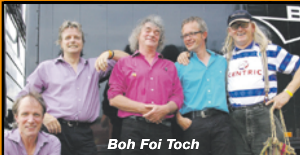
Boh Foi Toch