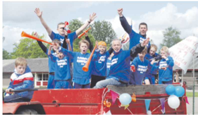
De trotse jongens van SCK F1 zijn afgelopen zaterdag kampioen geworden

KLARENBEEK.- De jongens van de F1 van Sportclub Klarenbeek (SCK) zijn zaterdag 12 mei kampioen geworden. Na een overtuigende 17-2 zege op eigen veld kon het feest beginnen. Na vele felicitaties, een beker en een T-shirt met tekst: "F1 kampioen 2012" kon de rondrit op de platte wagen beginnen. Teruggekomen werd er patat en drinken genuttigd en 's middags nog een gezellige BBQ.