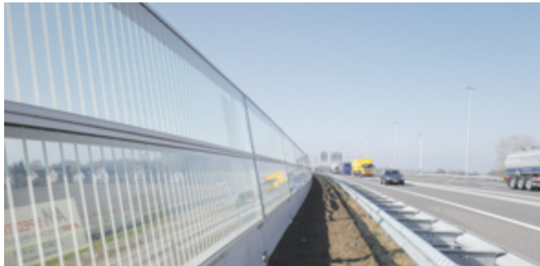
Geluidsscherm gezien vanaf de A1

Al vanaf 1984 is de gemeente Voorst op zoek naar financiële mogelijkheden om een geluidsscherm te plaatsen. In 2005/2006 beloofden het college en de raad dat de maatregelen er nu echt zouden komen, met als resultaat de 'opening' van het scherm vandaag. Met de subsidie van Regio Stedendriehoek van € 548.400 en eigen budget van € 400.000 is het scherm, van 2,6m hoog en 724m lang, nu gerealiseerd. De subsidie die uit het regiocontract beschikbaar is gekomen is gebaseerd op de innovativiteit van het geluidsabsorberende scherm. Het vernieuwende van het scherm is de creatieve overgang van groen naar blauw, met bovenstaande bijbehorende uitleg daarvan. Het deels glazen scherm reduceert de geluidsoverlast door verkeersgeluid,