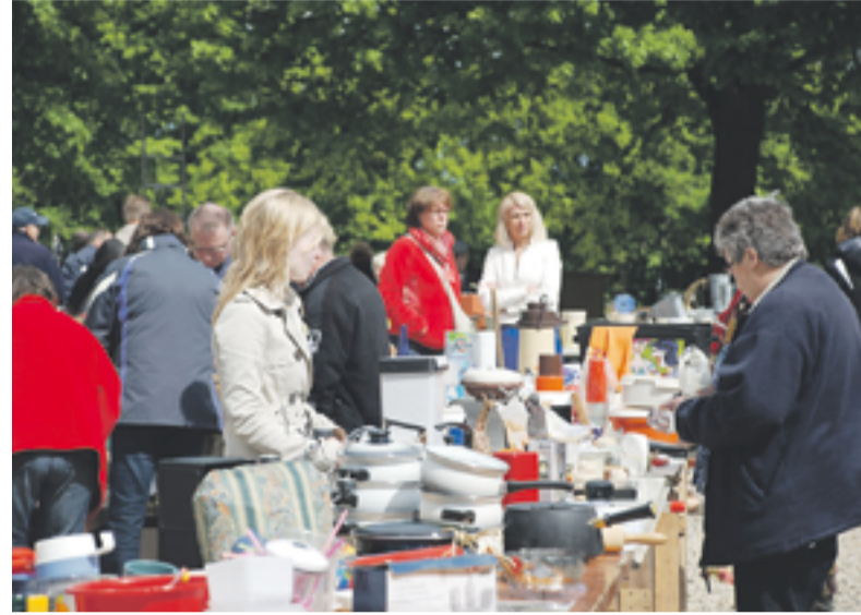
Het was weer gezellig tijdens de afgelopen markt.

KLARENBEEK.- Voor het eerst in zes jaar hebben de leden van Muziekvereniging Klarenbeek (MVK) afgelopen zaterdag weer een rommelmarkt georganiseerd.