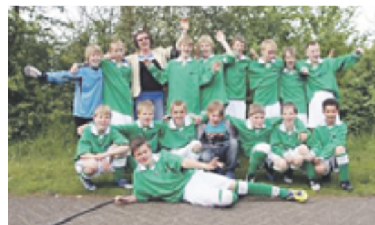
De Kopermolen zet topprestatie neer

van de Kopermolen is het avontuur echter nog niet afgelopen. Zij wisten als eerste te eindigen in hun poule. Deze knappe prestatie levert hen een rechtstreekse plaatsing op voor de derde ronde van het schoolvoetbaltoernooi. Zij mogen op 23 mei a.s. in Borculo aantreden en daar wederom laten zien wat zij in hun mars hebben. Daar mogen zij het opnemen tegen teams uit? De laatste wedstrijd tegen de winnaar uit de andere poule werd weliswaar verloren maar doordat zij reeds geplaatst waren voor de vol-