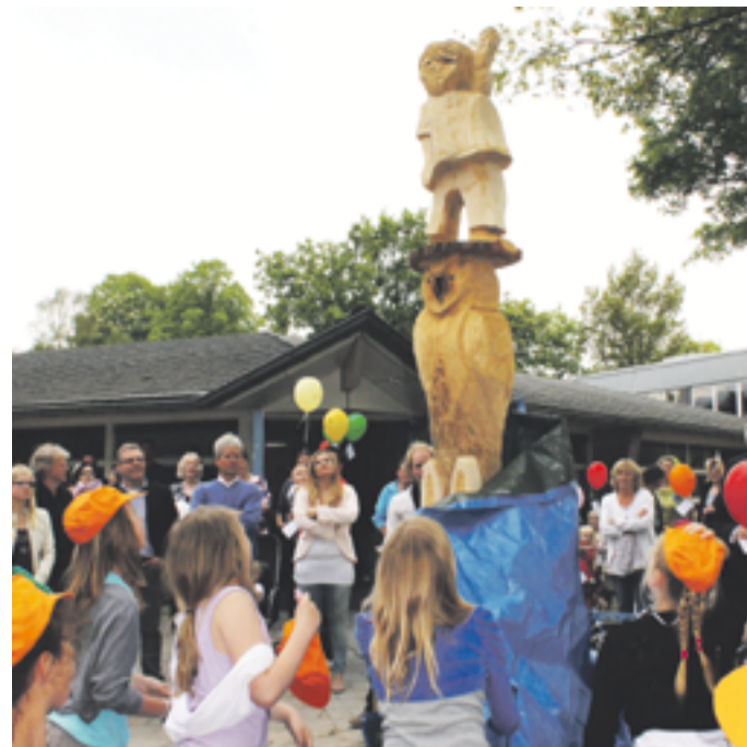
Het schoolspeelplein werd officieel geopend door het onthullen van een totempaal

Jantje Beton wil dat kinderen vrij buiten kunnen spelen in hun eigen buurt. Schoolpleinen kunnen een belangrijke speelfunctie hebben. Maar vaak zijn deze na schooltijd niet toegankelijk of sluit de inrichting niet aan bij spelwensen van kinderen. Jantje Beton stimuleert daarom scholen en gemeenten om van schoolpleinen echte openbare SchoolSpeelPleinen te maken. Kinderen spelen een belangrijke rol bij het ontwerp en de realisatie ervan.