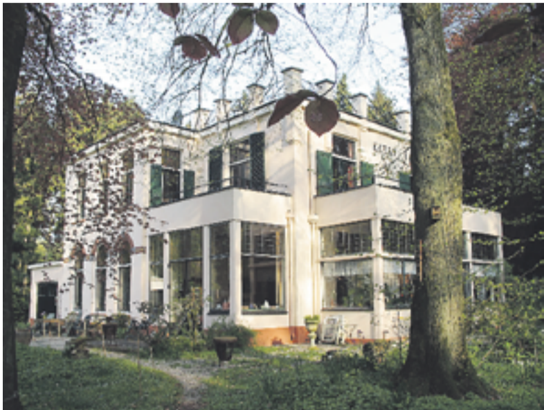
Huize Ekeby – een statig landgoed