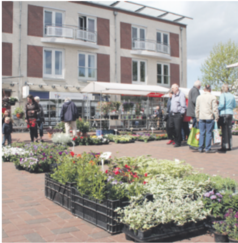
De bloemenmarkt biedt altijd weer een fleurige en kleurige indruk.

TWELLO.- Op het Marktplein in Twello was het afgelopen zaterdag een drukte van belang. De jaarlijkse voorjaars- en bloemenmarkt mag zich in toenemende mate verheugen in een grote publieke belangstelling. De organisatoren, de Stichting Dorpsverfraaiing en de ondernemersvereniging Twello Centrum stellen alles in het werk om deze speciaal opgezette markt te doen slagen. Hoewel het weer, wolkenvelden afgewisseld door flinke zonnige periodes, niet echt zomers aanvoelde, was het vanaf de openingsuren toch al lekker druk. Dat was met name waar te nemen bij de stands van de St. Dorpsverfraaiing, de medewerkers moesten dan ook alle zeilen bij zetten om een ieder van dienst te zijn bij de aankopen of met het geven van plantadviezen. Naast het aanbieden van allerlei plantgoed zoals eenjarigen, kuipplanten en vaste tuinplanten, gaven de medewerkers van de stichting uitleg over plantverzorging en natuurlijk deskundig plantadvies. Ook was er een keur aan verwante artikelen, zoals meststoffen etc. De Stichting Dorpsverfraaiing Twello is vooral bekend van de prachtige bloembakken die het dorp jaarlijks sieren, maar liefst 50 stuks. Deze worden door vrijwilligers beplant, beheerd en onderhouden. Dat dit de sfeer in het dorp ten goede komt zal duidelijk zijn. Ondanks de onbaatzuchtige inzet van deze vrijwilligers kan men ook