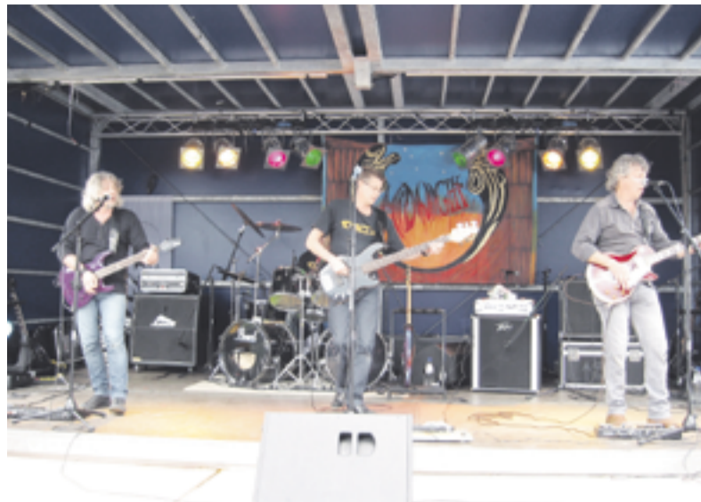
Midnight op het podium in Posterenk