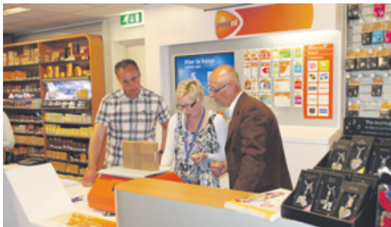
De nieuwe postbalie bij Oonk.

TWELLO. - Afgelopen maandag ging bij boekhandel Oonk een nieuwe service van start. Boekhandel Oonk, met name bekend door haar grote assortiment tijdschriften, tabakswaaren, wenskaarten en kantoorartikelen, heeft nu ook het postkantoor van PostNL en ING-servicepunt voor bankzaken binnen haar muren. In de vernieuwde winkel bevindt de balie van PostNL zich bij de winkellaska en is er een ING-servicepunt voor bankzaken. De openingstijden zijn gelijk aan die van de winkel. Klanten kunnen nu sneller en makkelijker hun postzaken van PostNL en dagelijkse bankzaken van de ING regelen. Het Postkantoor van PostNL verkoopt het volledige PostNL assortiment. Klanten kunnen er terecht voor het kopen van postzegels tot het versturen van alle soorten pakketten en brieven binnen en buiten Nederland. Uiteraard kan men er ook enveloppen, verpakkingendozen, cadeaubonnen en