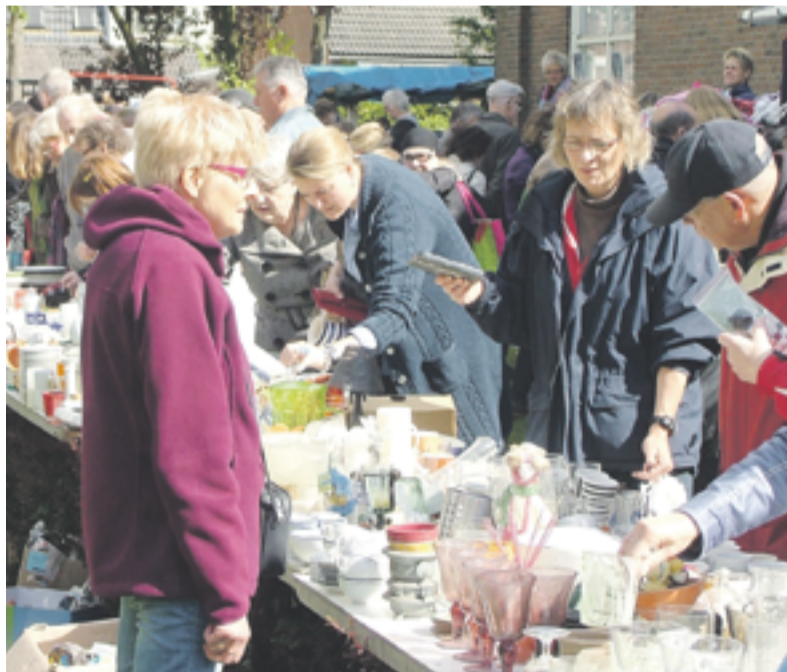
Het was weer gezellig rond snuffelen op de rommelmarkt bij de Radboudkerk aan de Twelloseweg.

DE WORP. Over belangstelling had de organisatie van de rommelmarkt rondom de Radboudkerk niet te klagen. De aan de Twelloseweg gelegen kerk was zaterdag weer het decor voor de jaarlijkse rommelmarkt en veiling. Koopjesjagers stonden ruim voor aanvang al te dringen om iets fraais op de kop te tikken. De rommelmarkt, die iedere tweede zaterdag in mei gehouden wordt, is altijd weer een succes. Het is bovendien een erg gezellige markt. De organisatie had in de afgelopen maanden dan ook weer veel bruikbare goederen ingezameld om de markt te doen slagen. Deze goederen waren voornamelijk afkomstig van particulieren die op zolder of in de schuur opruiming hadden gehouden. Boeken, meubels, kleding en divers huisraad, het was allemaal te vinden. Ook kinderspeelgoed en glaswerk was volop te koop. De wat duurdere goederen werden per opbod via de veiling verkocht. De opbrengst van de rommelmarkt, EUR 7000.00 komt ten goede aan de Radboudkerk.