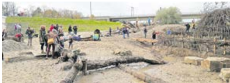
Kinderen genieten van de vorig jaar geopende natuur speelplek.

Het beeld dat beklijft, is dat van een trotse man. Een man die hard en streng was voor zichzelf. Willem permitteerde zichzelf geen luxe. Fooi van een klant accepteerde hij niet. Onder regie van de Werkgroep Waanders is het legaat van ruim 120.000 euro omgezet in zichtbare verfraaiingen van het Worpplantsoen. Zo werd vorig jaar een prachtige natuur speelplek geopend nabij het Worpplantsoen. Voor meer informatie hierover zie: www.waanders-worpplantsoen.nl