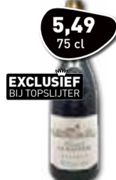
EXCLUSIEF BIJ TOPSLIJTER DOMAINE DE LA BASTIDE IGP Pays d'Oc Réserve Rouge Normaal 6.99