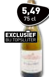
EXCLUSIEF BIJ TOPSLIJTER DOMAINE DE LA BASTIDE IGP Pays d'Oc Réserve Blanc Normaal 6.99