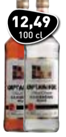
OLD CAPTAIN RUM Wit of Bruin