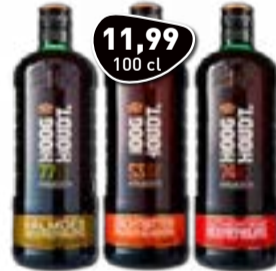
HOOGHOUDT Kalmoes Beerenburg, Zachtbitter of Beerenburg