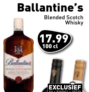
Ballantine's Blended Scotch Whisky