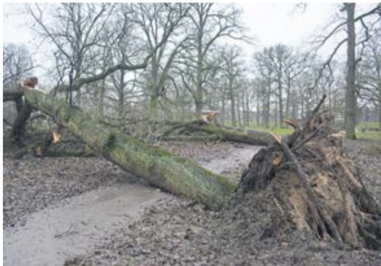
In het Worpplantsoen heeft de westerstorm flinke schade veroorzaakt.

DE WORP.- Wie momenteel langs het Worpplantsoen loopt ziet direct dat de westerstorm vorige week donderdag flinke schade heeft veroorzaakt. Tenminste 15 bomen zijn door de wind omver geblazen. Een aantal hebben in hun val ook auto's beschadigd. Medewerkers van het Deventer Groenbedrijf zijn druk in de weer geweest om de omgevallen 'reuzen' tot kortere delen te zagen. De grond in het Worpplantsoen is mede door de hoge waterstand zompig geworden. In combinatie met de westerstorm heeft het de bomen makkelijk doen omvallen. Zelfs de wortels van de bomen kwamen tijdens de val omhoog. Enorm triest om te zien dat de natuur zoveel schade heeft aangericht in het oude stadspark. Het is nog niet duidelijk wanneer alle omgevallen bomen worden opgeruimd. Door het hoge water zijn een aantal plekken in het plantsoen niet goed bereikbaar.