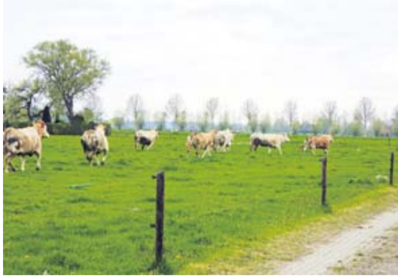
Weer in de wei

Rudy Rabbinge is een deskundige van wereldfaam. Hij studeerde af als plantenziektkundige aan de Wageningen Universiteit. Na zijn promotie werd hij er hoogleraar Duurzame Ontwikkeling en Voedselzekerheid. Daarnaast vervulde en vervult hij bestuurlijke functies in de private en de publieke sector en in interna-