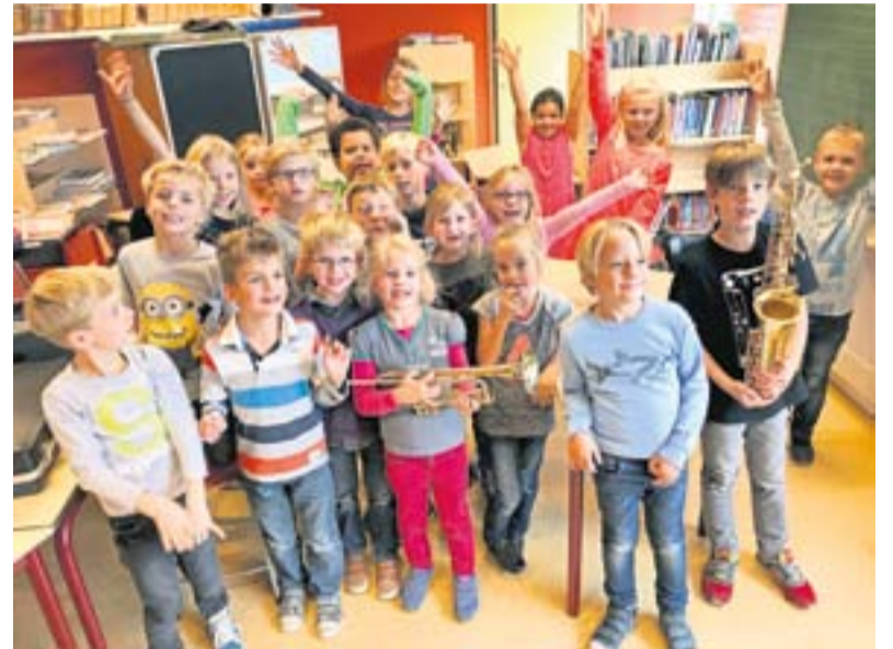
De leerlingen van Sjaloom waren enthousiast

Voor iedereen die interesse heeft in het leren bespelen van een instrument bestaat de mogelijkheid om zich op te geven voor 2 gratis proeflessen. De fanfare repeteert elke dinsdag van 19.30 tot 21.45 uur in het Dorpshuis in Voorst. Kom gerust eens kijken en luisteren en ben je al muzikant? Neem je instrument mee en speel zelf eens mee. Je bent van harte welkom.