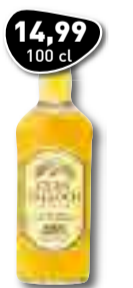
14,99 100 cl GLEN TALLOCH Blended Scotch Whisky