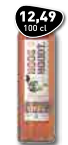
12,49 100 cl HOOGHOUDT Vieux