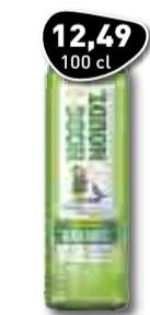
12,49 100 cl HOOGHOUDT Jonge Dubbele Graanjenever