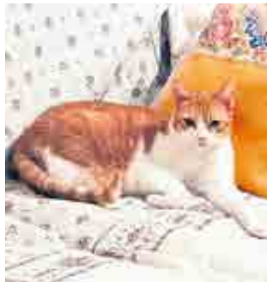
Ik ben als vermist opgegeven vanaf de Torenbosch in Twello.

Rode poes met witte snuit, borst, buik en poten, binnenkat: Torenbosch, Twello. Zwart katertje, enkele witte haartjes op de borst, knikje in staart, slungelig gebouwd: Hoofdweg, Klarenbeek. Witte poes met zwarte vlekken, zwart op de kop, vlekken rug, gevlekte staart: Leemsteeg, Wilp-Achterhoek. Zwarte poes met groene ogen: Weterschoten, Klarenbeek.