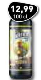
12,99 100 cl JACHTBITTER Kruidenbitter