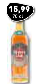
15,99 70 cl HAVANA CLUB Añejo Especial