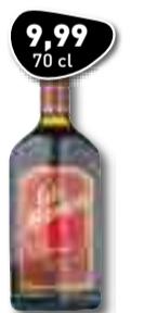
9,99 70 cl CAFÉ MARAKESH Koffiëleukeur