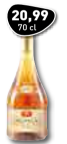
20,99 70 cl JOSEPH GUY VS Cognac