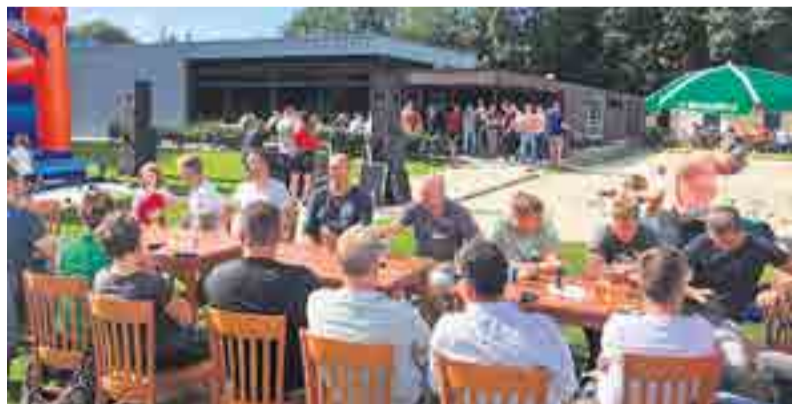
Sportiviteit en gezelligheid op het terrein van SV CCW'16.

Bij CCW'16 werd aan het begin van de zomer begonnen met beachtennis en -volleybal. Onder leiding van een trainer werd het tennis aardig populair in Wilp. Zolang de weersomstandigheden meezitten word er zelfs nog wekelijks een balletje geslagen. Deze trainingen zijn na-