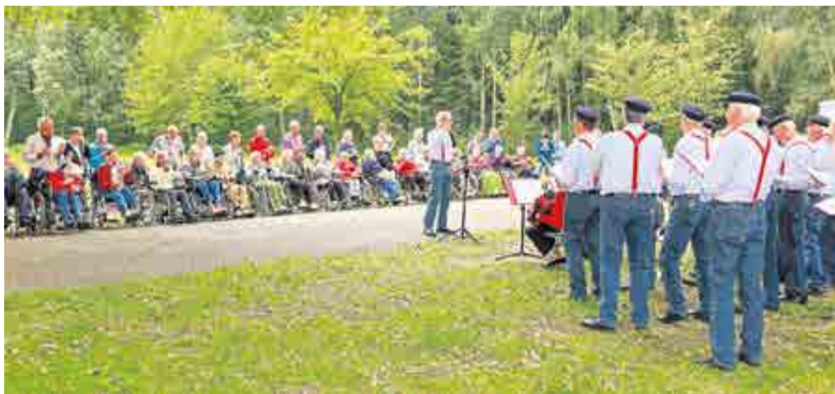
De gasten van de Zonnebloem genieten van het optreden van "De trossen los."