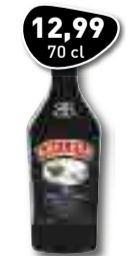
12,99 70 cl BAILEYS The Original