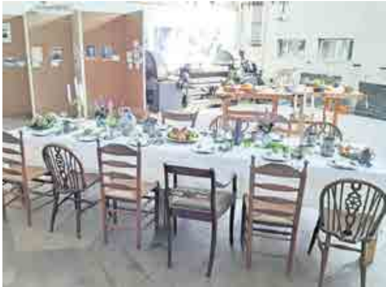
Hier een impressie van de tentoonstellingsruimte.